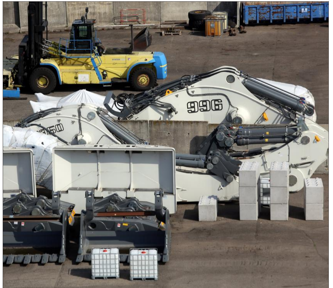
Une pelle minière et des éléments de deux autres pelles forment le chargement exceptionnel de 645 tonnes pour cette péniche à destination d'Afrique du Sud via le port de Zeebrugge, en Belgique.