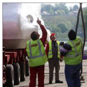
L'attention est à son comble au sol pour assurer ce chargement exceptionnel.