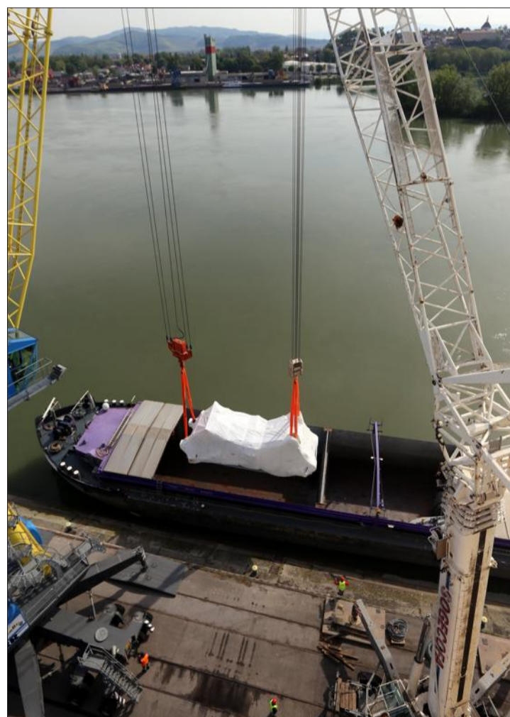
Levé simultanément par deux grues, le chargement de cette pièce de plus de 100 tonnes nécessite une coordination sans faille.