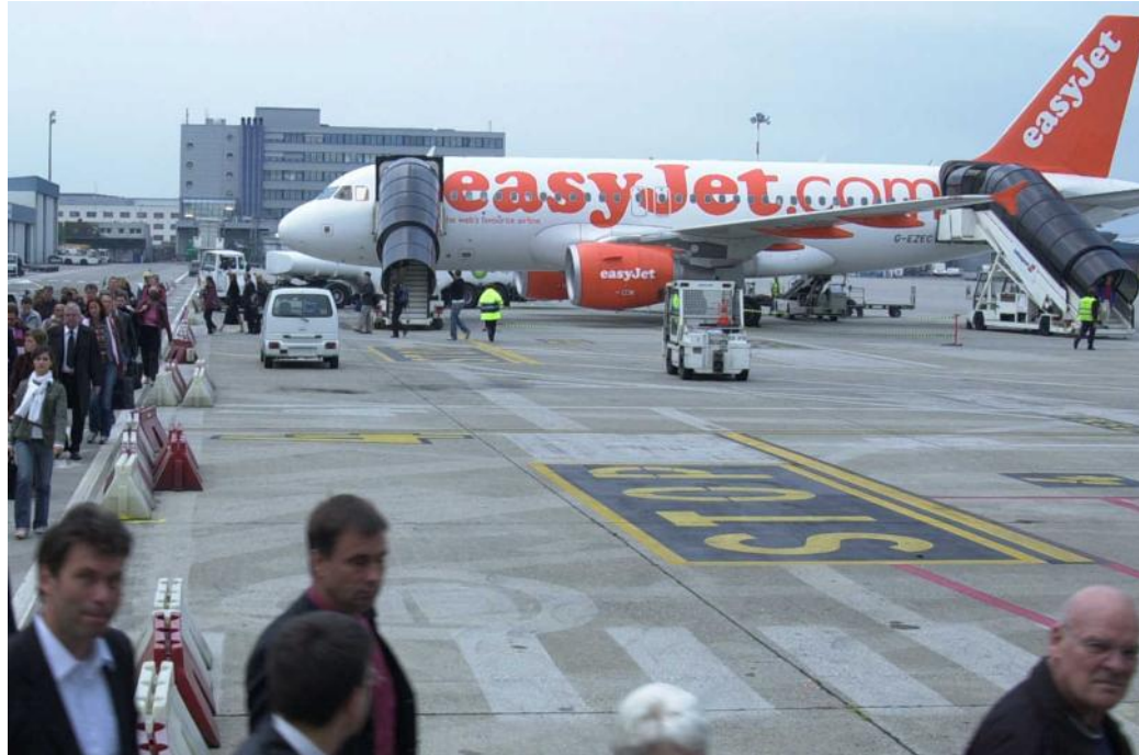
Avec 2,715 millions de billets vendus (51% du volume passagers), EasyJet est restée en 2012 la première compagnie aérienne de l'Euroairport.

Avec l'arrivée, ce printemps, de SunExpress et le retour de Ryanair, qui crée deux escales dix ans après avoir claqué la porte, Strasbourg-Entzheim espère continuer sur sa lancée. Il faudra pour cela compenser l'arrêt des