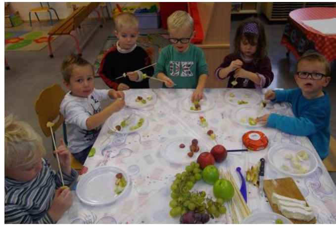
La préparation de succulentes brochettes.

brochettes de fruits et fromage, des compotes, soupes, jus de raisins et de pommes, tartines de fromage et radis, ainsi que des tartines de fromage et poivrons sur des concombres. La classe des grands a réalisé une tarte aux pommes et un clafoutis aux poires comme la maman de petit ogre. L'équipe enseignante a été secondée par des parents d'élèves lors de ces ateliers, et les enfants sont rentrés avec une partie des plats pour les faire goûter dans leurs familles. ■